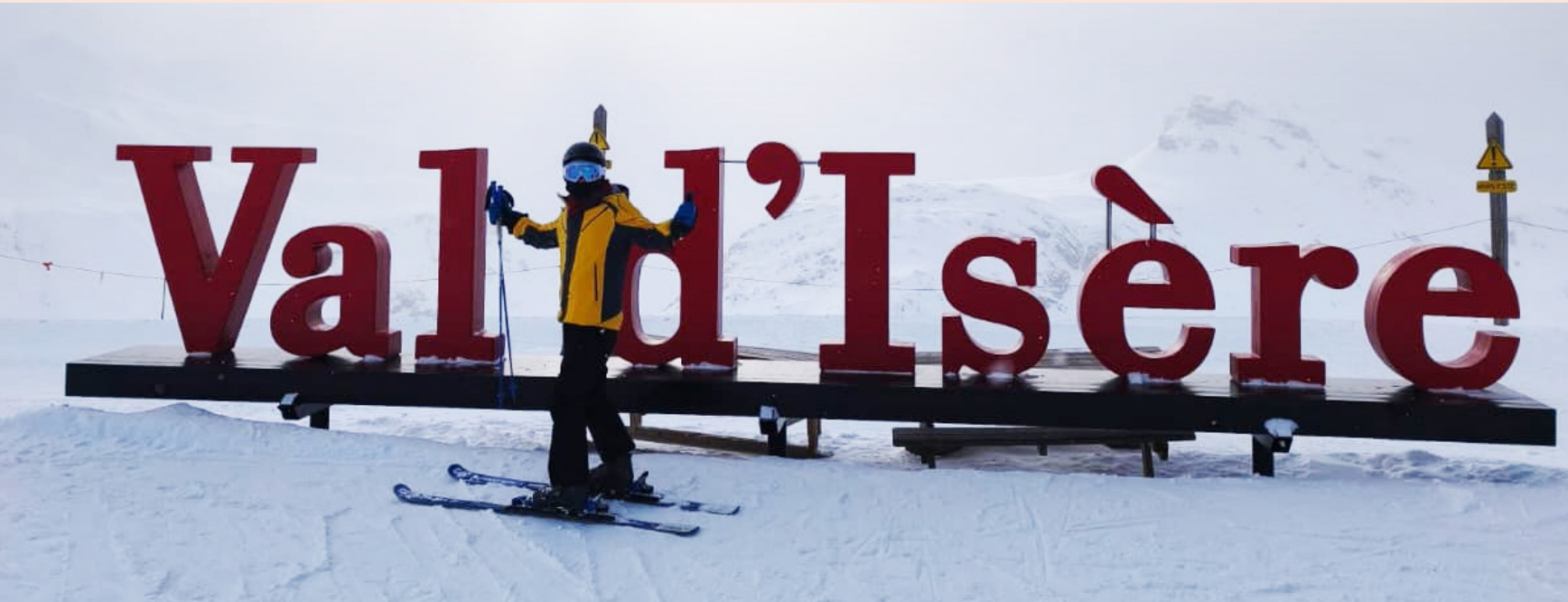
Club Med地中海俱乐部·瓦勒迪泽尔度假村