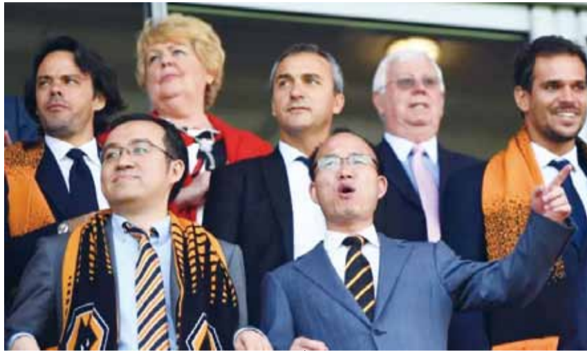
复星国际董事长郭广昌亲赴赛场为狼队助威

在复星集团的领导下，狼队青训学院将培养年轻有实力的球员视为一个重要目标。5月23日，狼队官方宣布，与18岁的英