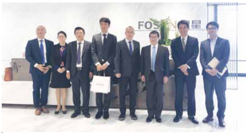
与会代表合影：复星国际董事郭广昌（右四）、新任日本驻沪总领事矶侯秋男（右三）

5 月 6 日，复星国际董事长郭广昌在 BFC 外滩金融中心会晤新任日本驻沪总领事矶侯秋男。复星全球合伙人、日本荣誉首代、IDERA 副董事长兼 CEO 山田卓也陪同与会。