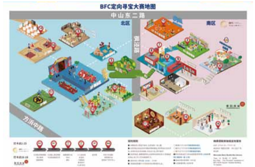
BFC 嘉年华 18 个打卡点寻宝地图

复星工会表示，今后每年5月15日“国际家庭日”后的第一个周六，将成为“复星家庭日”的嘉年华活动日。“复星一家”工会将在全球举办丰富多样的主题活动，邀约复星员工及全球家庭共度健康、快乐、富足的幸福欢乐时光。