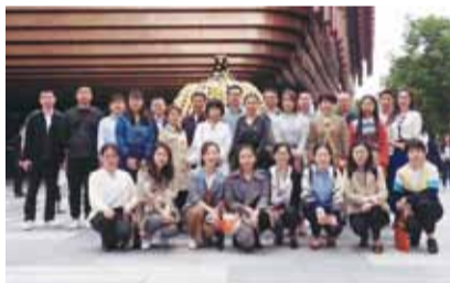
草间弥生奇幻大胆的艺术世界深深震撼了参观者，以艺术串起交流，影响深刻

5.18复星家庭日BFC亲子嘉年华当天，6家滨江成员企业组织员工家庭参与。提升了党建工作感召力，促进区域资源对接，拓展滨江党建“朋友圈”，提升了复星文化活动和滨江党建文化品牌影响力。