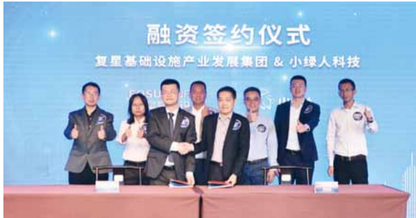
小绿人融资签约仪式

5月20日，“复星·小绿人投资签约暨大出行战略合作发布会”在上海豫园海上梨园厅举行。会上，复星正式宣布完成针对电动自行车户外共享充电桩龙头企业小绿人科技的B轮独家投资，同时整合内部的大出行企业生态资源，共同为共享化智能化的城市出行探索可持续发展的解决方案。