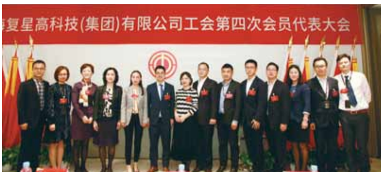
复星工会新一届班子成立，高起点上新启航

复地企发工会坚持走大循环之路，在助推发展上下功夫，拓展工会工作深度；坚持做大工作格局，在工会自身建设上下功夫，彰显组织力度；三是坚持放大员工声音，在和谐创建上下功夫，传递企业温度。