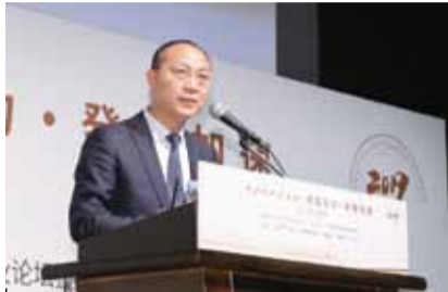
复星国际执行董事、高级副总裁龚平：中日文化、商贸交流会更深入