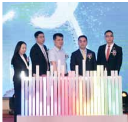
复星保德信河南分公司开业典礼

5月21日，复星保德信人寿保险有限公司河南分公司开业典礼在郑州举行。河南省保险行业协会相关领导、复星保德信中高层管理人员以及渠道合作伙伴、媒体代表等出席了开业典礼。