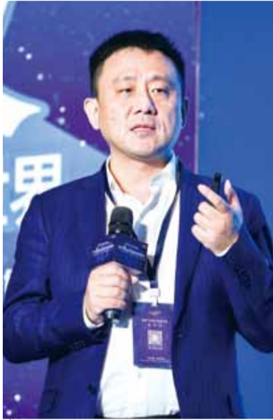
复星国际联席总裁陈启宇：创新药是战略布局，仿制药在未来中国也一定会继续

近日，晨哨集团主办的第六届全球投资并购峰会在上海举行。来自跨境投资并购相关领域的专家学者、政府领导、商业领袖围绕“正在重新定义的投资世界”的主题进行了系列演讲和圆桌讨论。峰会演讲嘉宾，复星国际联席总裁、复星医药董事长陈启宇在峰会现场接受了晨哨并购专访，就科创板、“4+7”带量采购、医药投资方向等当下关注热点问题发表了自己的观点，以下为采访实录整理：