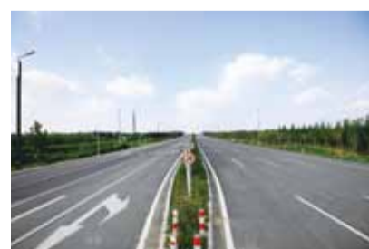
开港大道投入运营

随着开封瞩目的开港大道PPP项目建成通车，一条联通郑州航空港的便捷大通道，一条承接港区经济辐射的经济大通道，一条串联多个产业组团的发展大通道呈现眼前。