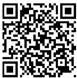
扫码看孩子们眼中的幸福