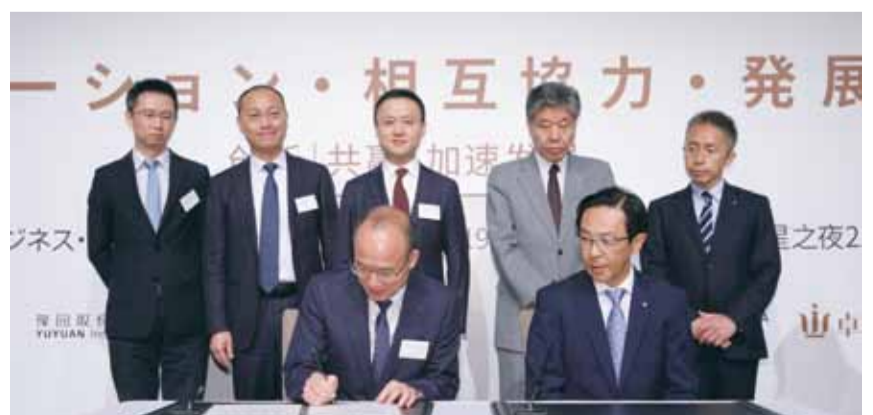
复星与京都府战略合作，双方将在文化、旅游、科技、医疗领域深入合作

京都府知事西胁隆俊在论坛上表示：京都自古以来就是日本文化艺术的故乡，通过将高水平的技术和美学升华到日本文化中，形成了独特的文化产物，并融入了每个时代的感性。在一个新时代开始之际，我们希望通过京都和复星之间合作，互动文化、加强技术力和企业力，并带来进一步的创新。