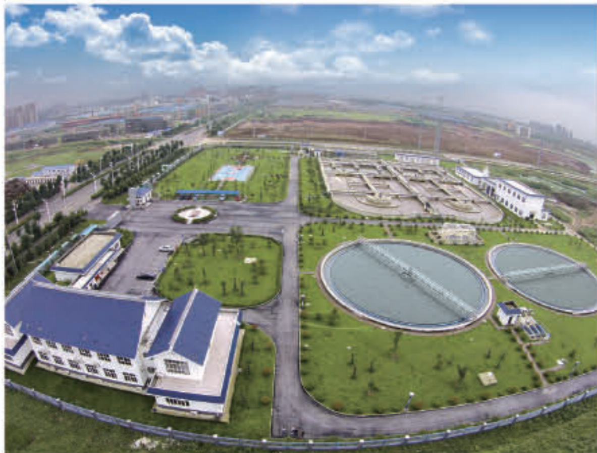
滁州市城东污水处理厂鸟瞰图