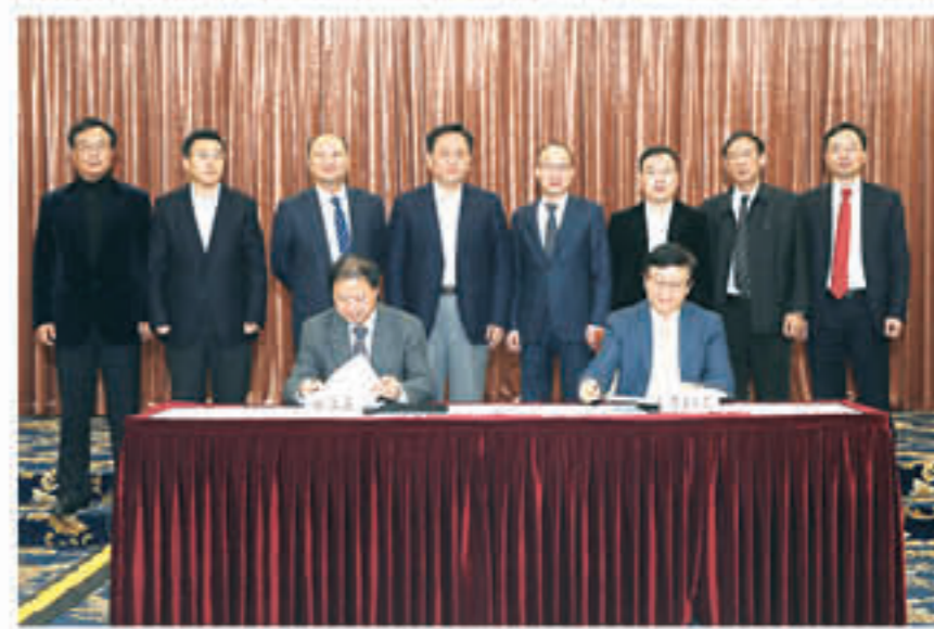
复宏汉霖世界级生物医药基地落户上海松江,主要为满足产品陆续上市后的产能需求

在研发创新方面,复星医药在全球配置创新资源,通过在中国、美国、以色列、瑞典的布局,建立互动一体化的研发体系。复星医药持续加大研发投入,数据显示,上半年复星医药的研发投入(含资本化)较2016年同期增长超过28%。2017年前三季度,复星医药加大对生