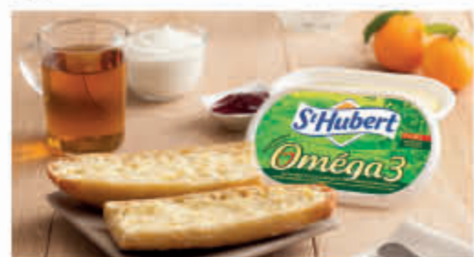
不久的将来,法国植物酸奶等乳制品可能会不断丰富三元产品线,依托“母乳数据库”打造新产品

至此,北京三元食品股份有限公司与复星共同持有Brassica TopCo S.A.及PPN Management SAS(“目标公司”)100%股权。三元股份指出,本次股权交割完成,对公司在大健康产业的布局至关重要。