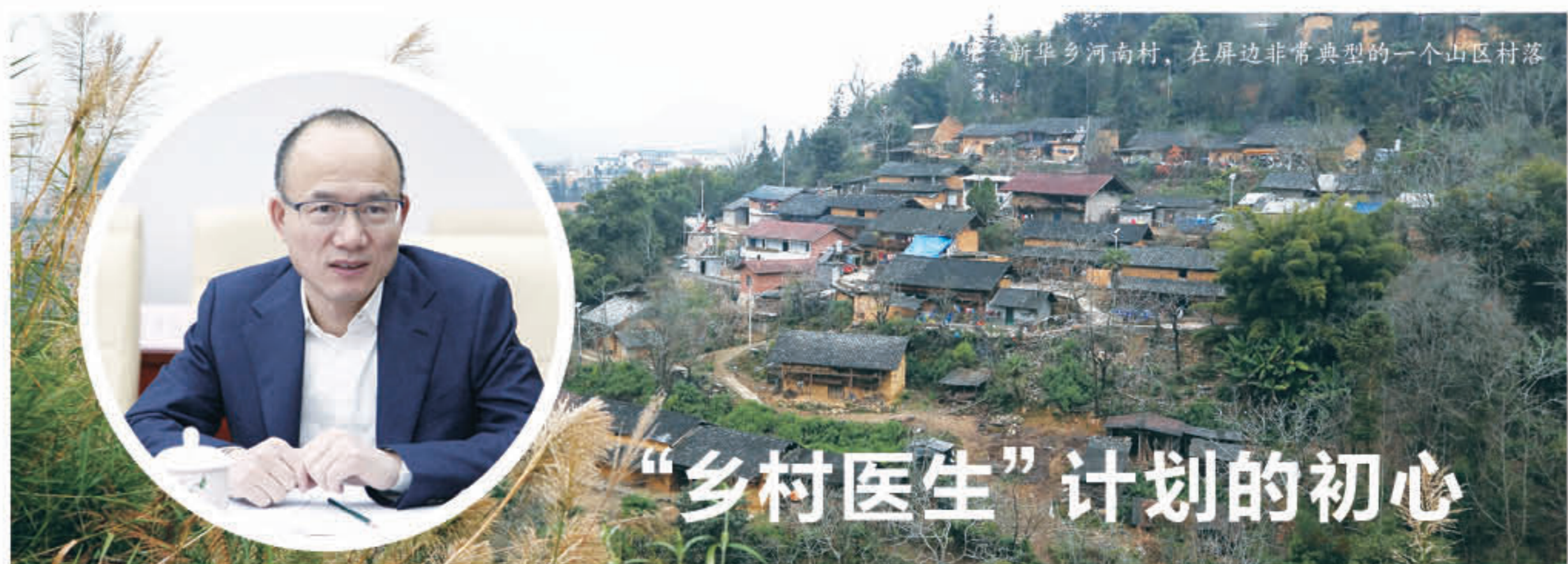
新华乡河南村，在屏边非常典型的一个山区村落

中国医师协会的数据显示，2015年，我国乡村医生从业人数已超过140万，分布在全国3.7万个乡镇卫生院和65万个乡卫生室，肩负着我国6.7亿农村居民的基本公共卫生服务以及常见病、多发病的初级诊治等基本医疗服。总体来说，乡村医生总数量呈增长趋势，但存在男女比例严重失调，队伍老龄化，缺乏高学历人才等结构问题。乡村医生面临着在岗村医专业能力亟待提升、在岗和离岗老年村医的老无所依、在岗村医收入低、缺少后备村医人才及村医执业环境改善及执业风险化解等5个迫切问题。