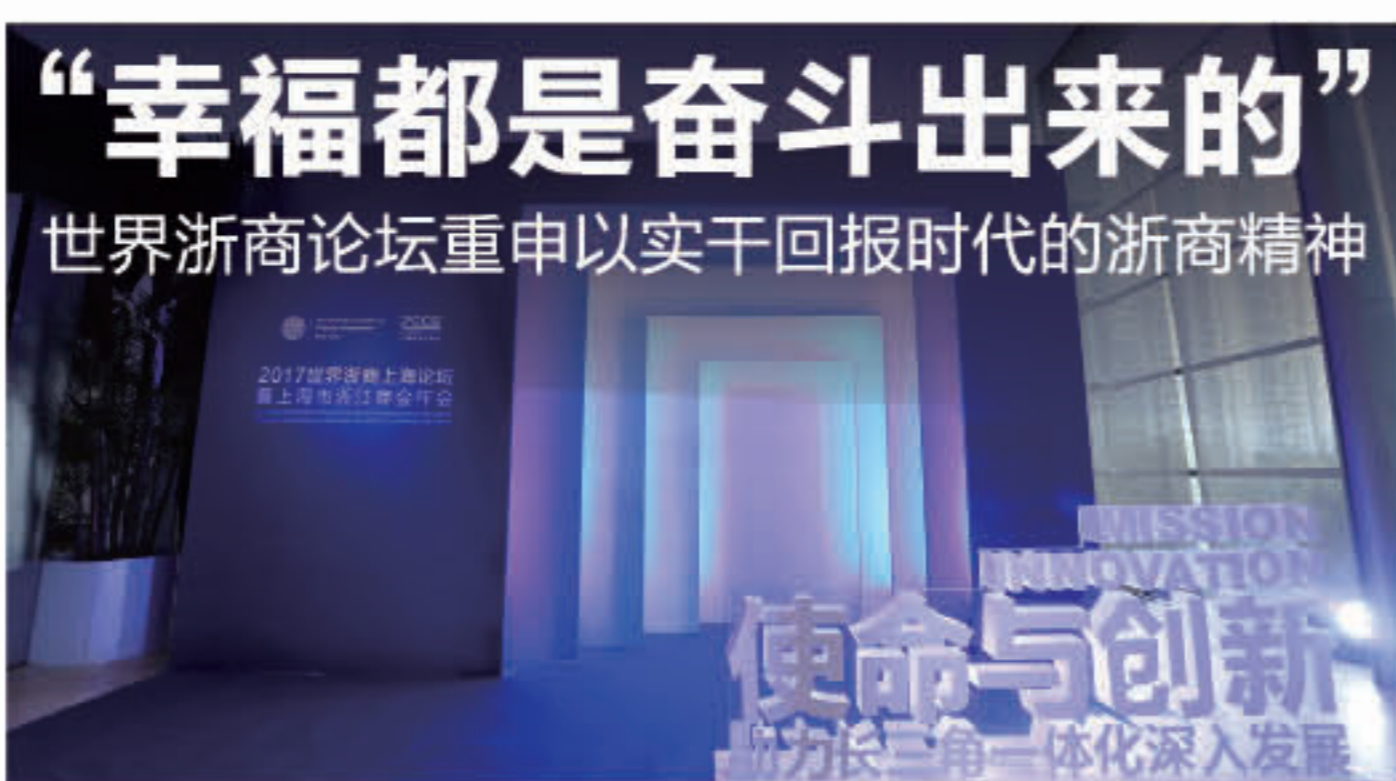
世界浙商论坛云集一群立志以实干无愧于时代的企业家