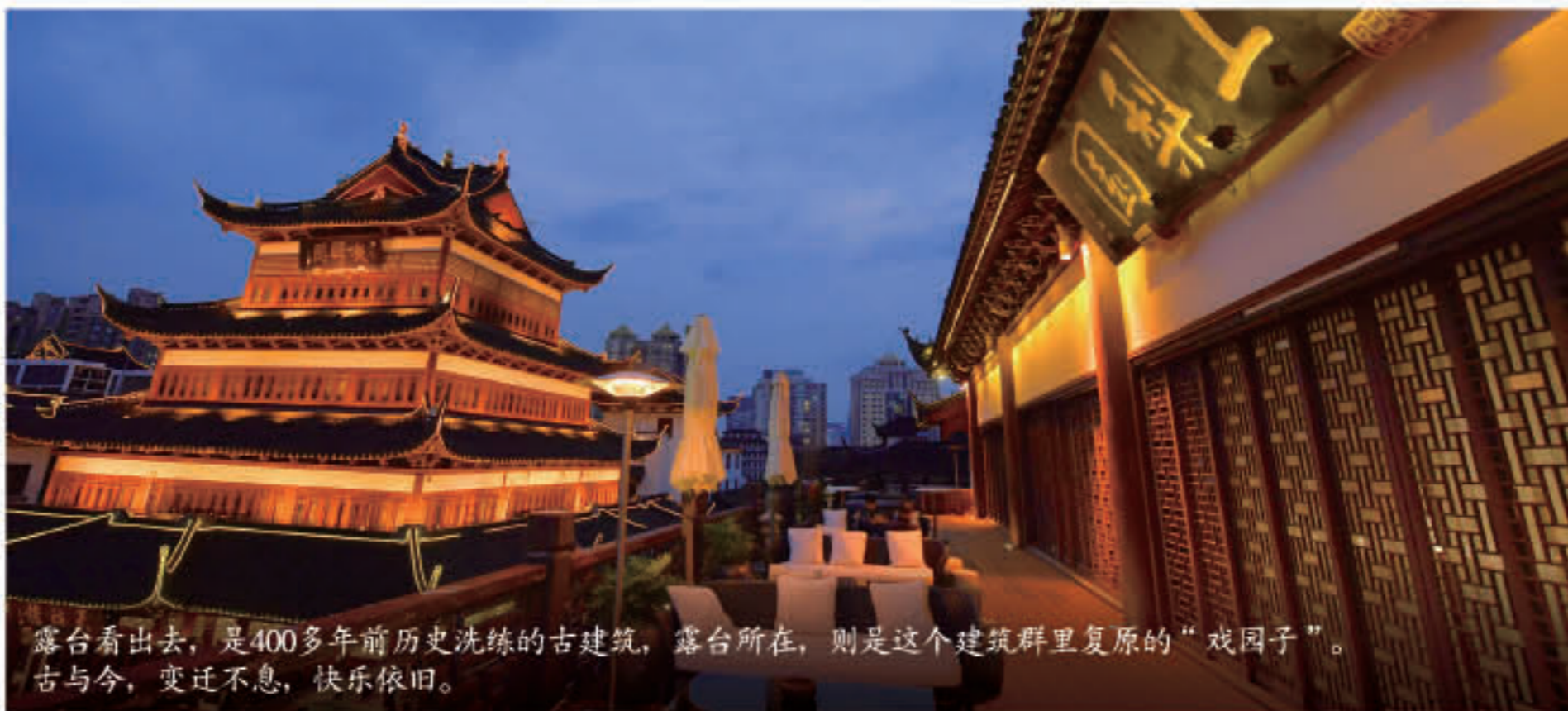
露台看上去，是400多年前历史洗练的古建筑，露台所在，则是这个建筑群复原的“戏园子”。古与今，变迁不息，快乐依旧。

“豫园漫步”是豫园升级改造的又一个场景，将聚焦于休闲娱乐业态与游览动线的调整优化，