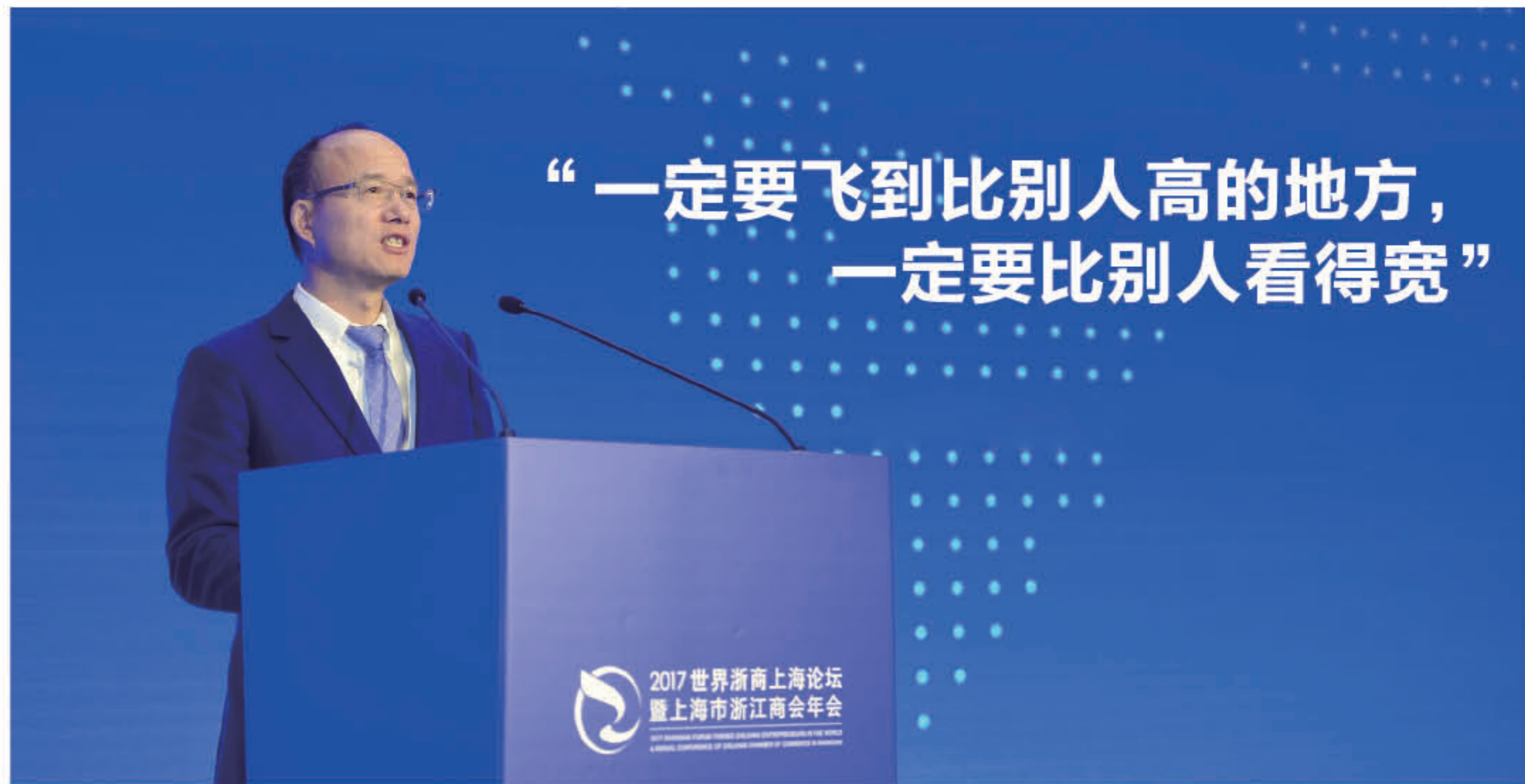
复星国际董事长郭广昌在世界浙商大会上发言，再三强调产品力和客户以及“多向年轻人学习”

2007年，复星国际在香港上市并开始全球化。十年来，越在海外发展就越感觉国家经济的强大是企业发展的根本动力。这十年，我们的经济总量增长了2.5倍，超越了日本成为全球第二大经济体，但这不是值得我们骄傲停顿的地方，我觉得到了哪一天，长三角的经济总量相当于日本的经济总量才是真正值得我们骄傲的时候。