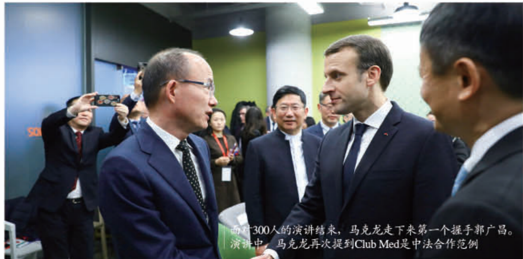
历时300人的演讲结束，马克龙走下来第一个握手郭广昌。演讲中，马克龙再次提到Club Med是中法合作范例。

1月9日中午，郭广昌在京出席了法国总统马克龙与中国顶级企业家代表小范围座谈会，参与座谈会的还有马云、马蔚华、屠光绍、徐井宏、戴巍，法国财长、科技部长等高级官员。2017年5月7日，马克龙成为法国历史上最年轻总统，中国是他新年伊始访问的首个亚洲国家。