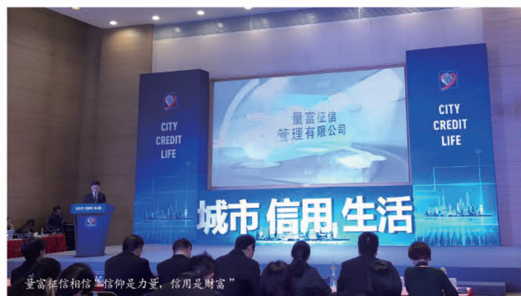
量富征信相信“信仰是力量，信用是财富”