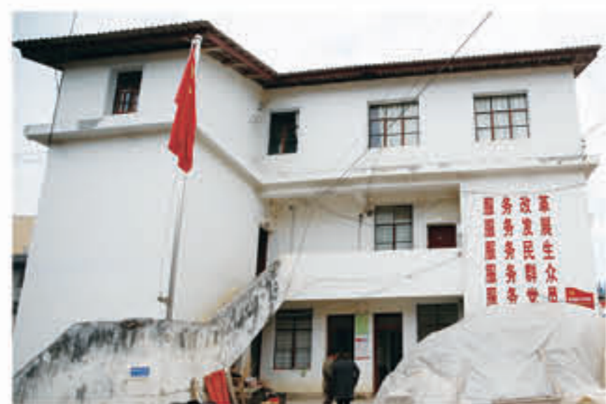
新街乡水田村的村卫生室