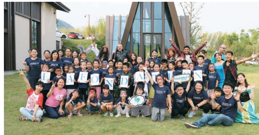
基金会成员、志愿者们与孩子们在活动后的合影