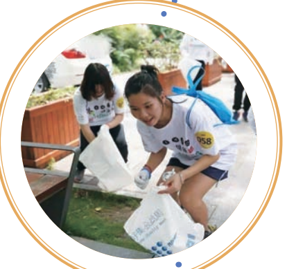
参与者在跑步过程中拿着回收袋捡起垃圾