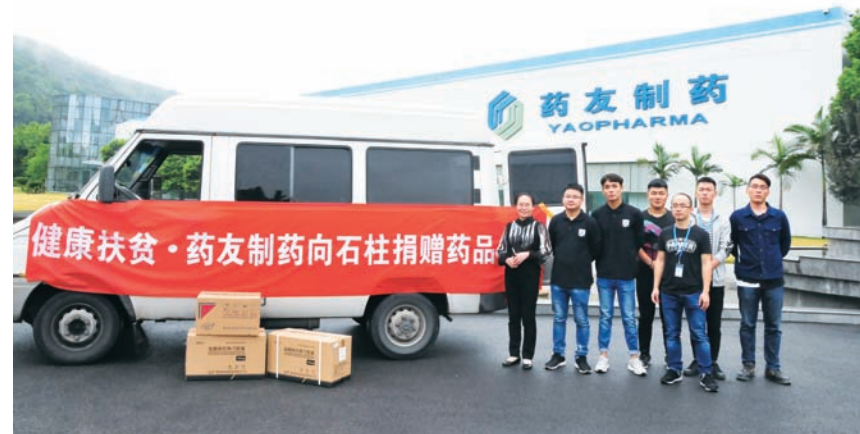
药友的小伙伴们出发前

在Club Med的发展历程中，一直秉承着这样的理念：为客户创造的幸福是需要被分享的。我们一起分享快乐和幸福，展现真自我。37年来，我们一直紧紧地团结在一起，履行着我们对于Club Med基金会所作出的承诺。 □ 孙颖