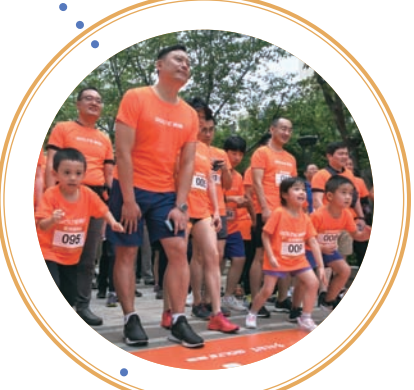
家长带着孩子们欢乐开跑

活力空间”、“大健康——健康生活中心”全新的三大主题概念，针对性地更新了涵盖亲子教培、餐饮娱乐、医美健康、精品零售超市等特色业态。除引入盒马鲜生、苏宁易购等新零售业态以外，还加强了对“大健康”业态的升级，以弥补区域内医美健康体验式商业的空白，为消费者带去全新的体验式消费场所。后续，复星智慧零售核心企业星纬控股旗下上海、天津、西安、杭州等城市的项目将接洽响应，“Go Plogging健康跑”系列活动会像圣火传递般持续到年底。 刘昌强