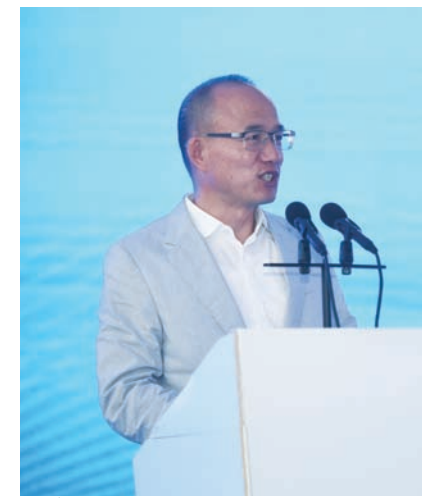
复星国际董事长郭广昌谈起FOLIDAY阿尔卑斯度假小镇的开业，盛赞“为全球贡献好产品”的思路

引言：9月14日，复星与捷成动力在复星艺术中心联合主办“绿色中国星行动·新能源汽车产业论坛暨复星投资捷成战略发布会”，宣布复星正式投资捷成动力，并将全面赋能捷成，打造中国乃至全球新能源动力电池行业的领导者。9月20日，复星旅文的FOLIDAY阿尔卑斯度假小镇项目在太仓正式开工。活动中，郭广昌也多次强调了产品力。