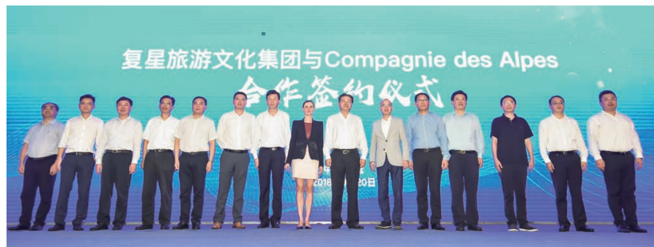
复星旅文与 CDA 在太仓签约

9月20日下午，太仓FOLIDAY阿尔卑斯度假小镇开工仪式暨复星旅游文化集团与Compagnie des Alpes (简称CDA) 合作签约仪式在太仓举办。