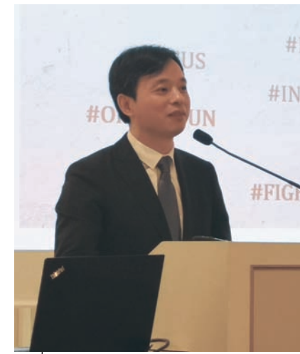
复星国际 CEO 汪群斌：时尚行业最让人兴奋的地方，就是能把绝妙的想法快速变为令人尖叫的好产品！

关于复星在时尚产业的布局与展望，我想分享几点想法：第一，时尚集团是复星“健康、快乐、富足”生态系统中的重要组成部分，它的目标非常明确：要成为世界一流，行业的前十、前三乃至第一的时尚集团。我们要打造全球化的时