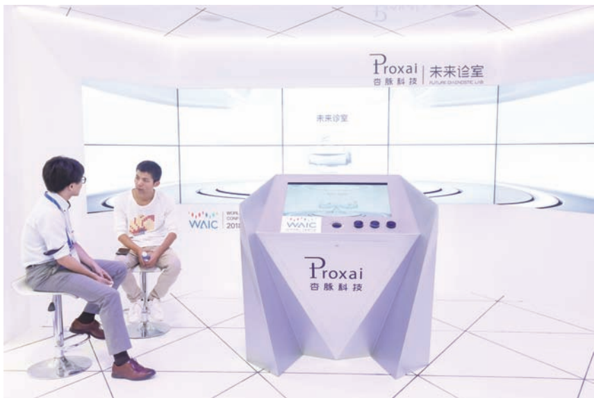
欢迎来到“未来诊室”

早筛、诊断与随访工作效率，促进医疗机构诊疗流程融合与服务升级，缓解基层医疗疑难杂症诊断难、资源少、效率低的困境。”