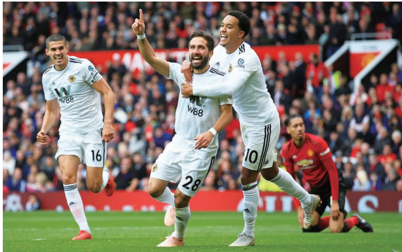
狼队在客场对阵曼联的比赛中庆祝进球

引言：北京时间9月22日22点，在英国曼彻斯特的老特拉福德球场，曼联队主场对阵狼队的英超比赛正式打响。到场观战的除了近75000名球迷之外，曼联传奇主帅弗格森爵士也在病愈之后首度重回“梦剧场”。