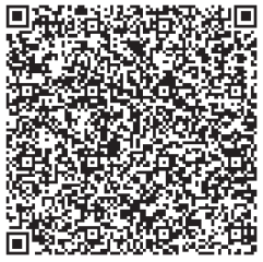
老庙黄金购买二维码